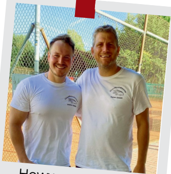
Howwemer Buwe gewinnen Ortspokal in Bürstadt